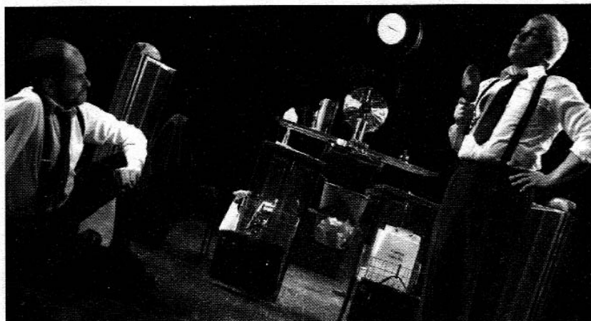
«Standard» ou le quotidien inattendu de deux employés de bureau.

La compagnie Mélimélo Fabrique propose donc désormais un catalogue de six spectacles, allant du très jeune public avec «Raoul» (65 représentations) à un public d'adolescents avec «XXelles» (34 représentations), en passant par «L'enfant Océan» (33 représentations) et «Les Signes» (28 représentations). Ce dernier a été joué cette année au festival national jeunes publics à Laval «Spectacles en recommandé» des ligues de l'enseignement. Il tournera aussi dans