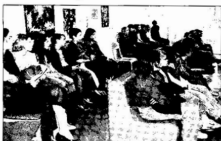
Un jeune auditoire très attentif.

Le collège André-Masson accueille à nouveau dans le cadre d'une « résidence d'artiste », programme culturel parrainé par Côté cour de la ligue FOL 70, la compagnie chaumontaise Mélimélo Fabrique et ce tout au long de l'année pour y effectuer un travail sur deux années, un travail de création et de sensibilisation aux arts du spectacle au travers de différentes formes d'action :